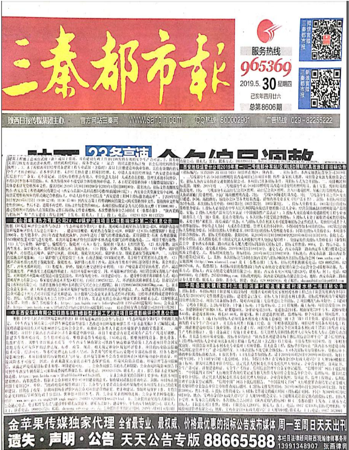
图 3-2 第二次信息公示报纸截图（一次）

我公司分别于 2019 年 5 月 30 日和 6 月 3 日，通过当地三秦都市报，对第二次公众参与信息进行了两次公示，公示内容见图 3-2、图 3-3。