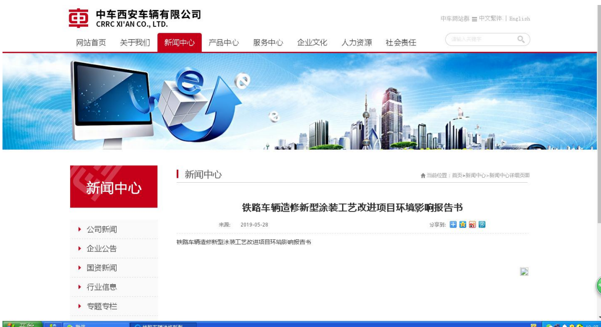
图 3-1 第二次信息公示网站截图

我公司于 2019 年 5 月 28 日在中车西安车辆有限公司网站上，对第二次公众参与信息进行了公示，公示时间为 10 个工作日。公示网址： https://www.crrcgc.cc/xa 。详见图 3-1。