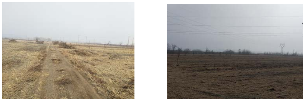
图 1 项目所在区域的地貌

本项目位于空港新城内，地处泾河以南，渭河以北，以平原为主，海拔 400 米~700 米，地势平坦，现场情况见图 1。