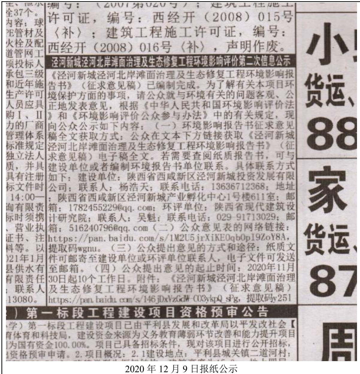
图3 环境影响评价信息二次公示（报纸）