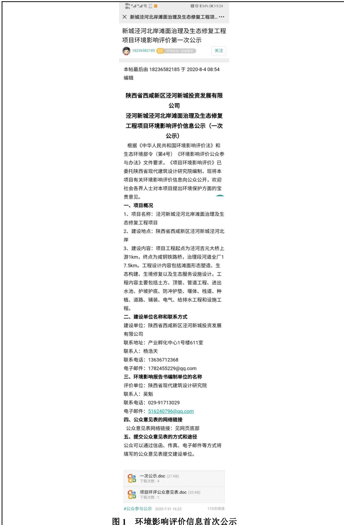
图1 环境影响评价信息首次公示