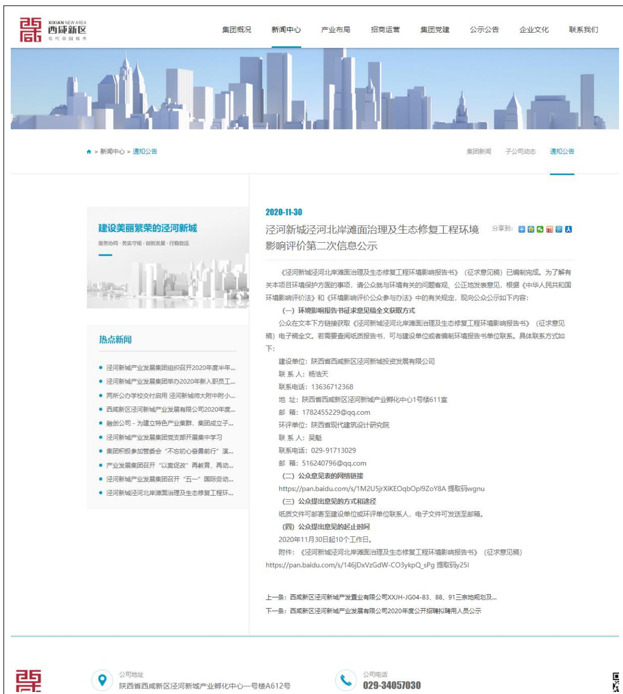
图 2 环境影响评价信息二次公示（网站）