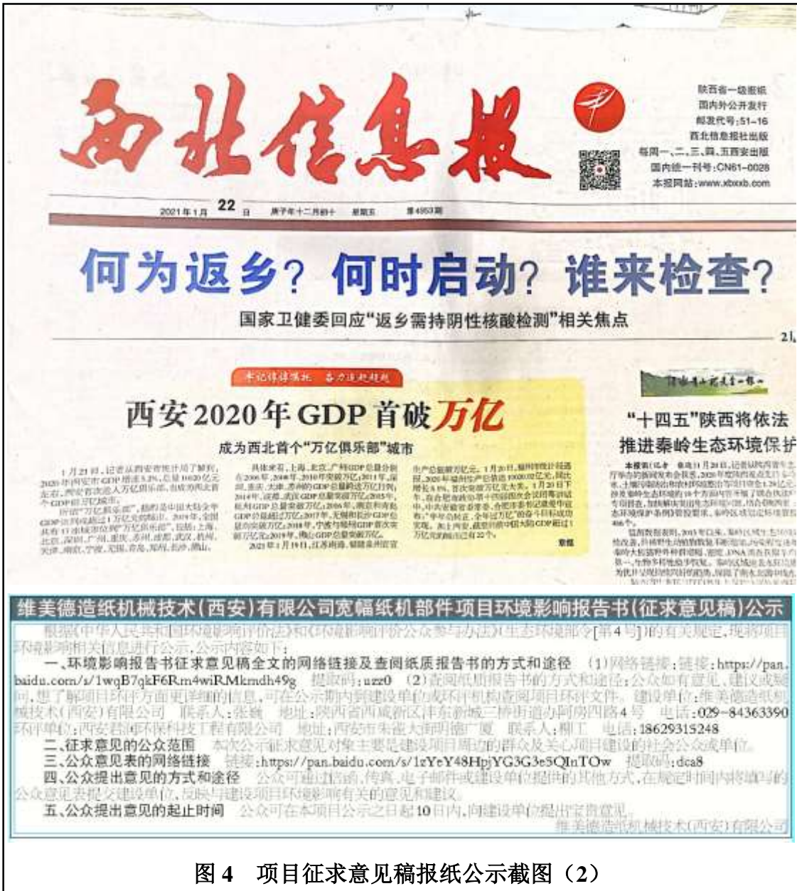
图 4 项目征求意见稿报纸公示截图（2）