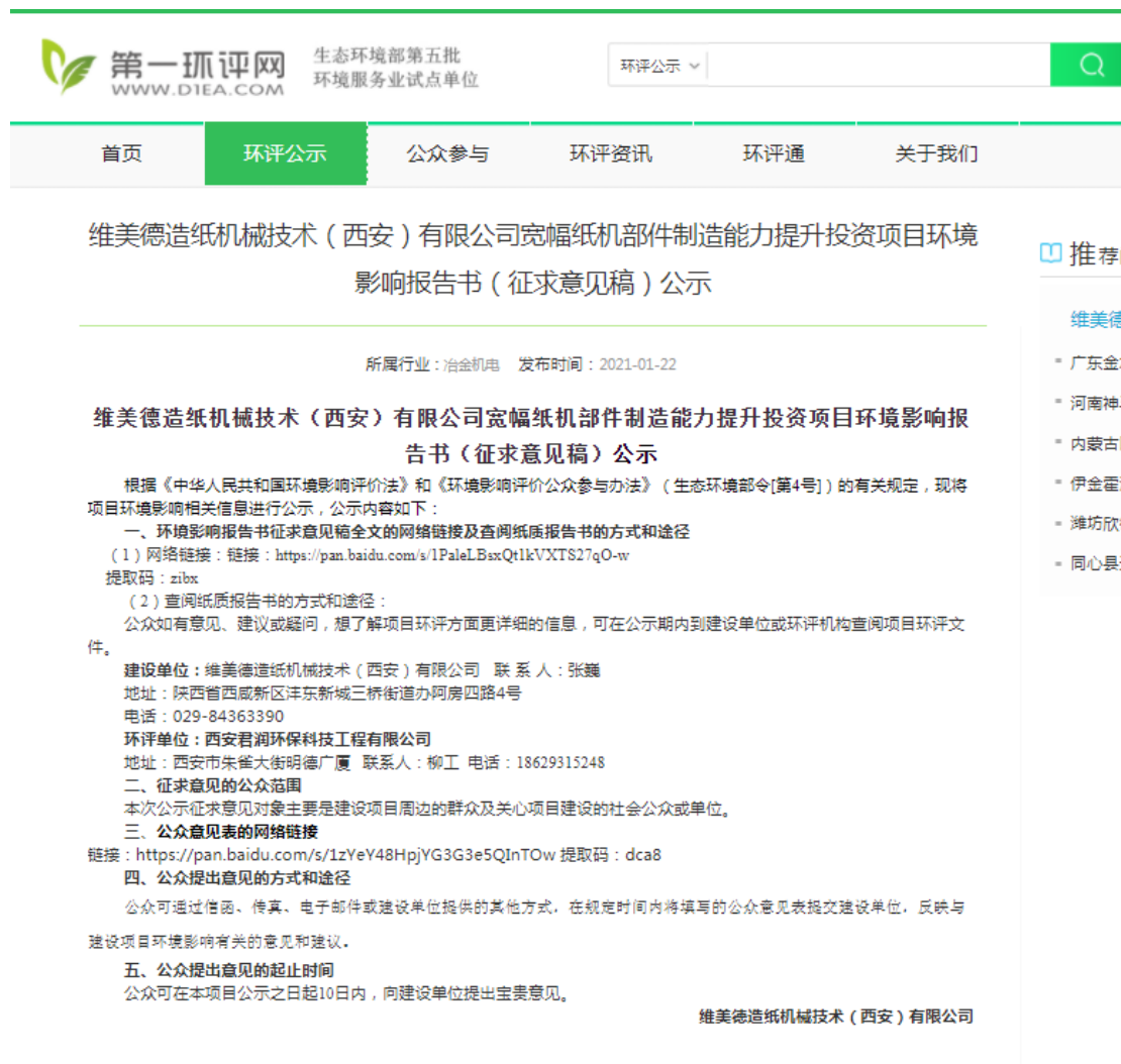
图 2 项目征求意见稿网络公示截图