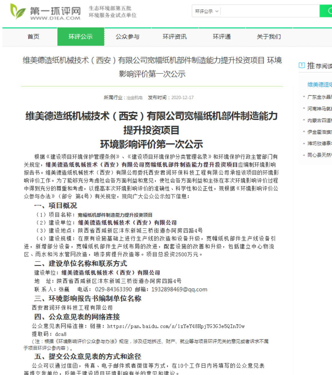
图1 项目首次公开情况网络公示截图