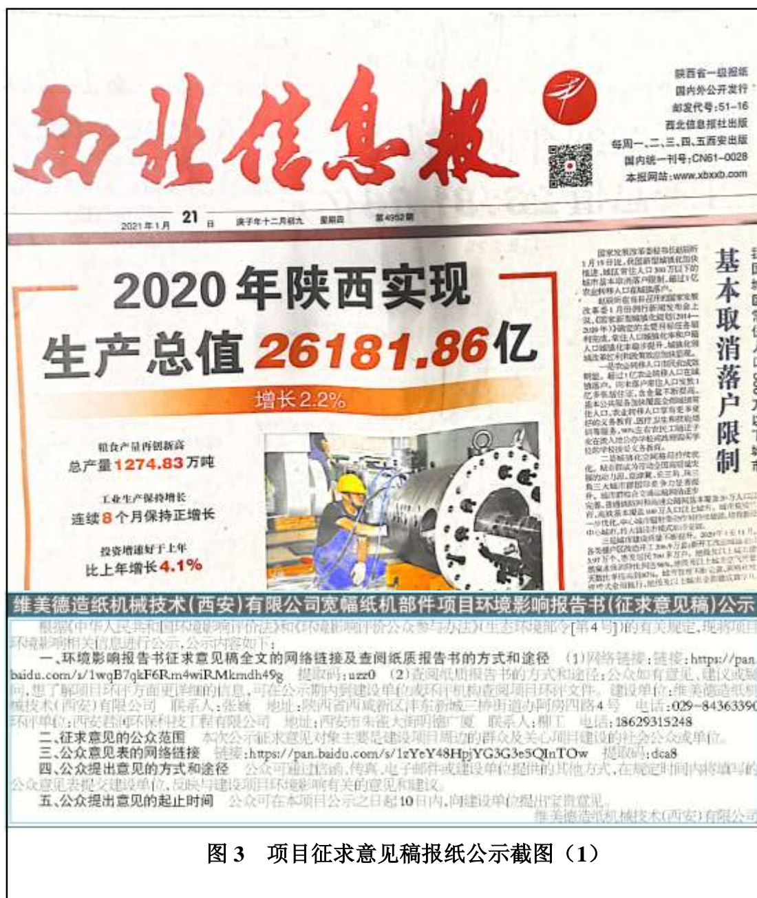
图3 项目征求意见稿报纸公示截图(1)